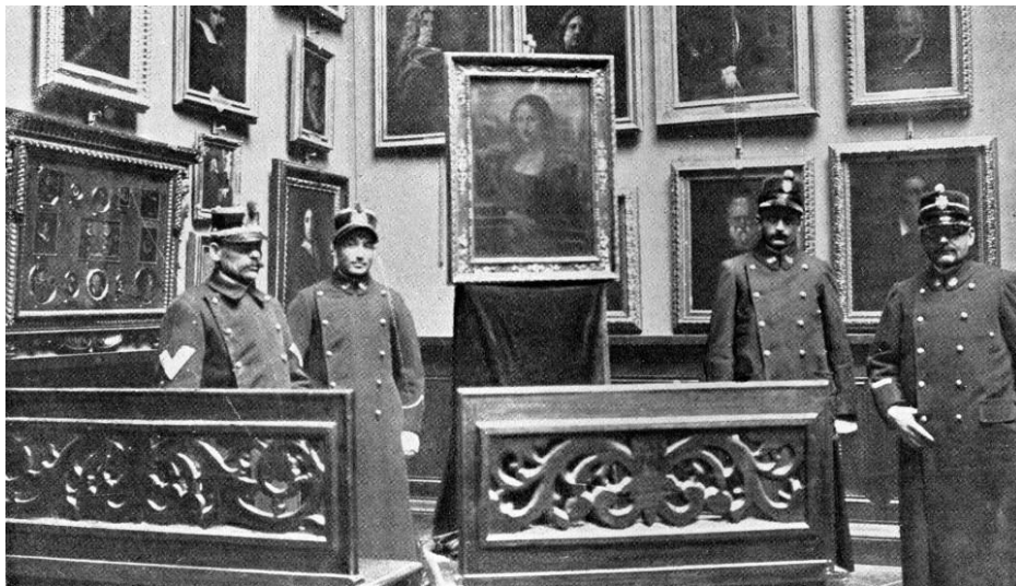
Übergabe der Mona Lisa an den Louvre, 1914