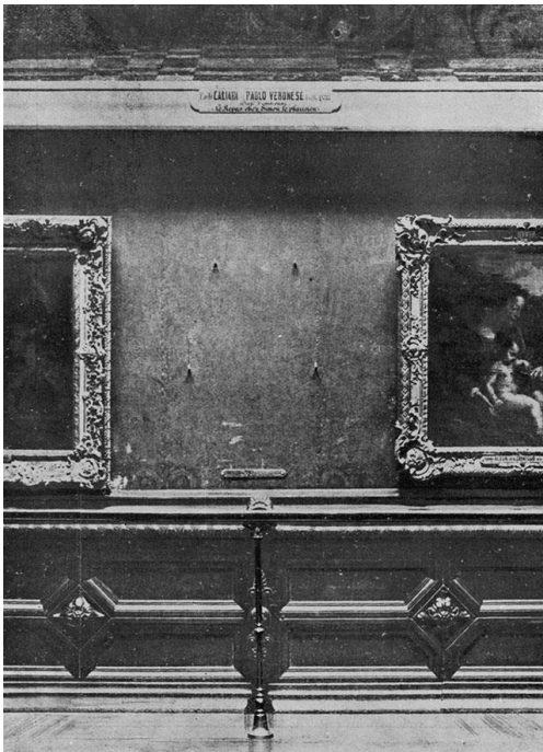
Die verwaiste Wand der Mona Lisa im Louvre

Da polizeiliche Ermittlungen ergebnislos blieben, wurden hohe Summen für die Wiederauffindung von Leonardo da Vincis Meisterwerk zur Belohnung ausgesetzt. Nachdem auch dieser Versuch erfolglos blieb, verbreiteten sich bald unterschiedliche Gerüchte über den Täter und sein Motiv. Zunächst wurde vermutet, dass ein Kunststudent das Gemälde entwendet haben sollte. Wenig später war von einem Geisteskranken die Rede, der das geheimnisvolle Lächeln der Mona Lisa nicht ertragen und das Bild deshalb zerstört haben sollte. Auch skrupellose amerikanische Kunstsammler standen unter Verdacht. Die Spekulationen kulminierten schließlich in der Behauptung, dass Frankreichs Erbfeind Deutschland die nationale Ikone entwendet habe, um von außenpolitischen Konflikten abzulenken.