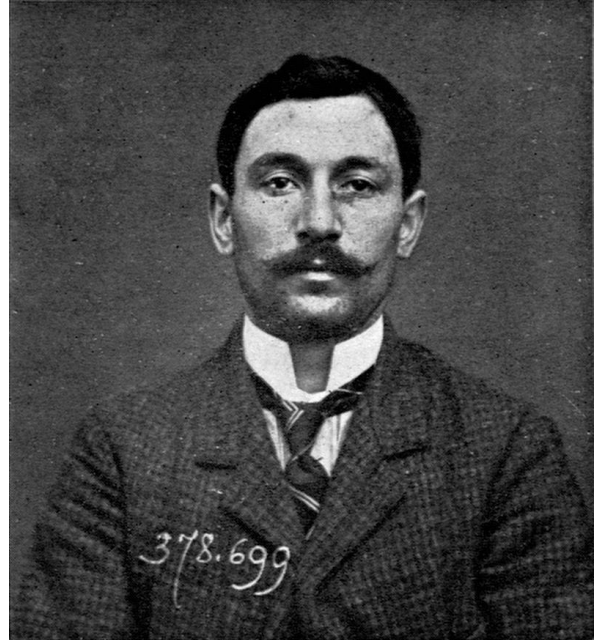
Polizeifoto von Vincenzo Peruggia, 1913