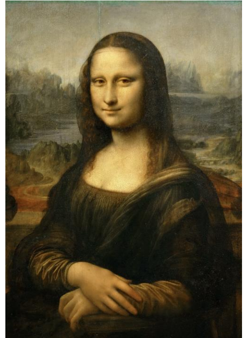
Leonardo da Vinci, Mona Lisa

Als die französische Öffentlichkeit am 21. August 1911 vom Raub der Mona Lisa aus dem Louvre erfuhr, glaubte man zunächst an einen schlechten Scherz. Es handelte sich jedoch keineswegs um eine sommerliche Zeitsungente, sondern um einen für unmöglich gehaltenen Vorfall, dessen Brisanz durch das Fehlen jeglicher Spur zum Täter zusätzlich verschärft wurde. Was war geschehen?