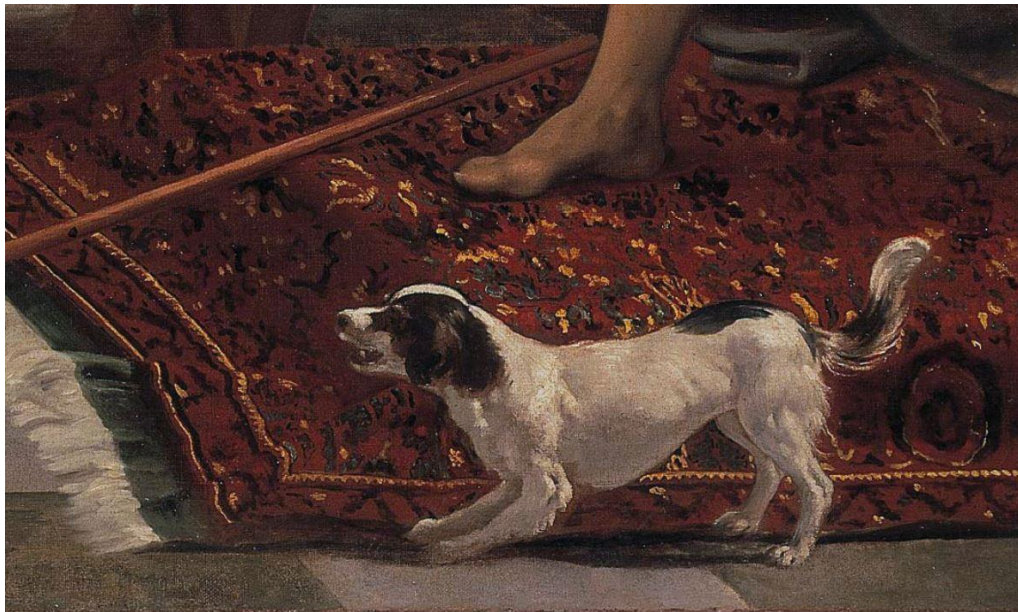
Diego Velázquez: Das Gewand Josefs (Ausschnitt), 1630