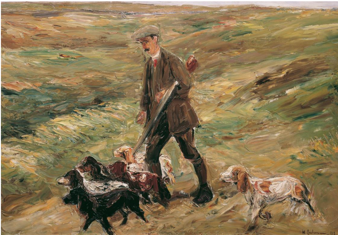
Max Liebermann: Jäger in den Dünen, 1913

Die Gänserupferinnen (1871, Nationalgalerie Berlin), Frau mit Ziegen (1890, Neue Pinakothek München), Schweinemarkt in Haarlem (1891, Städtische Kunsthalle Mannheim), Die Kuhhirtin (1894, Kunsthalle Bremen), Der Papageienmann (1902, Museum Folkwang Essen), Reiter und Reiterin am Strand (1903, Wallraf Richartz Museum Köln) und schließlich Jäger in den Dünen (1913, Oberes Belvedere Wien) - im Werk des deutschen Impressionisten Max Liebermann, der gemeinhin mit den atmosphärischen Darstellungen seines Gartens am Berliner Wannsee assoziiert wird, sind Tierdarstellungen weder eine Seltenheit noch Randerscheinung. Dabei setzt der Künstler das Tier stets in enge Verbindung zum Menschen. Das in gleichermaßen flottem wie sicherem Pinselduktus ausgeführte Gemälde Zwei Spaniels bildet nur auf den ersten Blick hiervon eine Ausnahme.