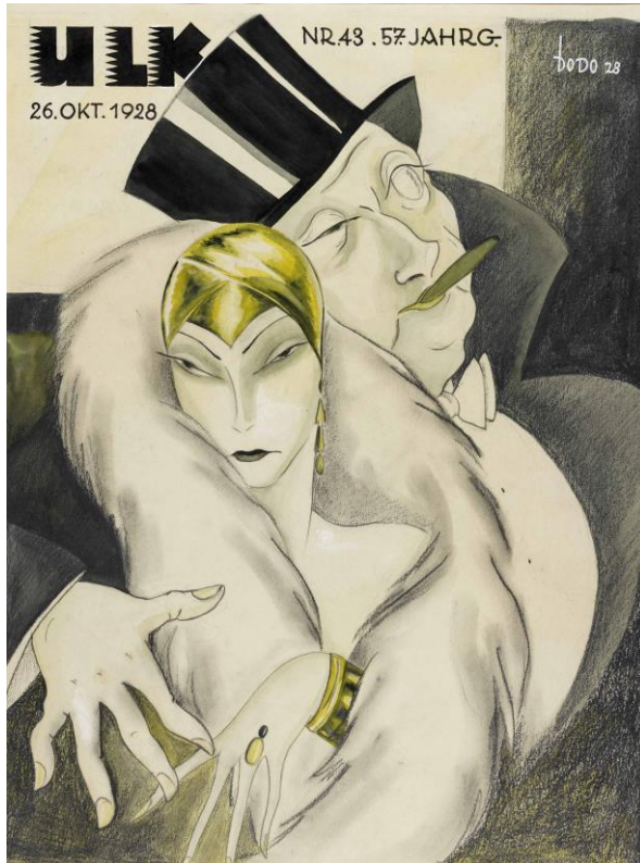
Dodo, Ihr Held (Titelseite des ULK), 1928

Zeichnungen, Gemälde und Skulpturen des 19. und 20. Jahrhunderts