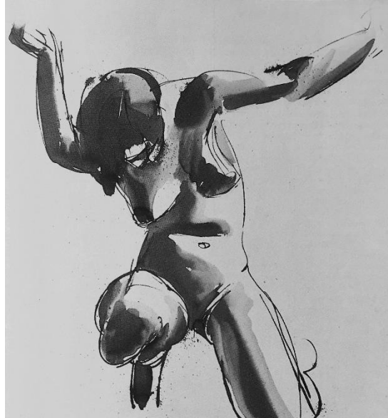
Abb. 1: Kniender Weiblicher Akt , um 1922

Zeichnungen, Gemälde und Skulpturen des 19. und 20. Jahrhunderts