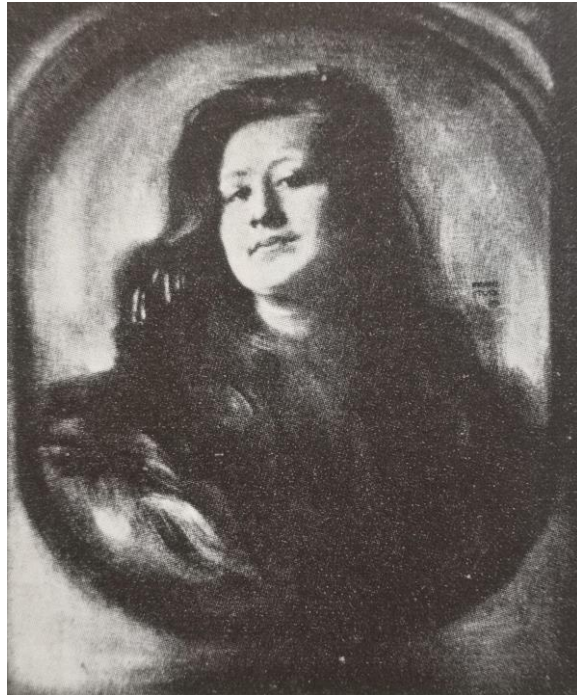
Franz Stuck: Weibliches Porträt , 1899 (Voss 126/433, dort irrtümlich auf 1896 datiert)

Zeichnungen, Gemälde und Skulpturen des 19. und 20. Jahrhunderts