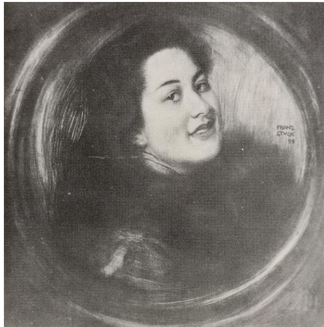
Franz Stuck: Weibliches Porträt , 1899 (Voss 187/439)