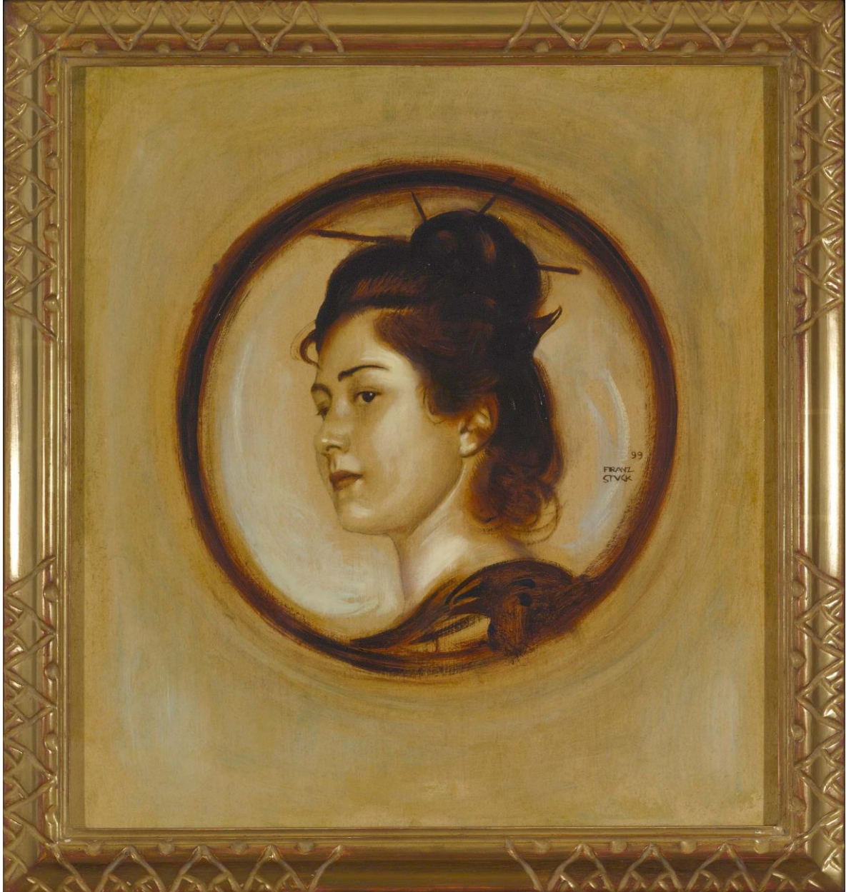
Franz Stuck: Bildnis einer Japanerin in aktueller Rahmung

Zeichnungen, Gemälde und Skulpturen des 19. und 20. Jahrhunderts