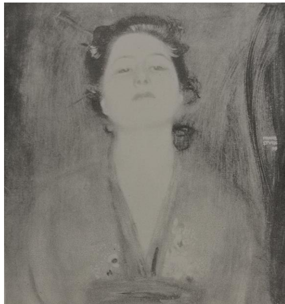
Franz Stuck: Weibliches Porträt , 1899 (Voss 188/440)